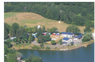
L'Anse du Lac à Pont-de-Salars 80 lits + 80 sous toile

- cinq sites de vacances d'été sous toile pour les enfants et adolescents, autour de thèmes tels que « La Piste Indienne », « Pêche », « Raid Aventure », ou « Indiana Parisot ».