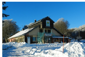
Le Chalet du Rouergue à Laguiole 45 lits