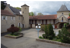
Le Domaine de Laurière à Villefranche-de-Rouergue 147 lits